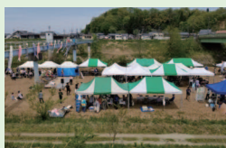
4/29 刈谷田川フェスティバル