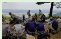
5/14 樺沢城山史跡保存会