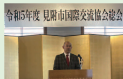
4/16 見附市国際交流協会総会