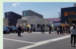
4/22 見附新町メディカルゾーン 見学会