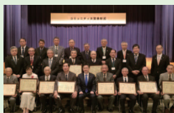
3/11 コミュニティ大賞表彰式