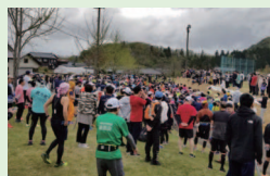
4/16 見附刈谷田川ハーフマラソン