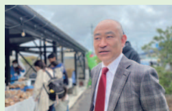
4/16 for mama あかり村