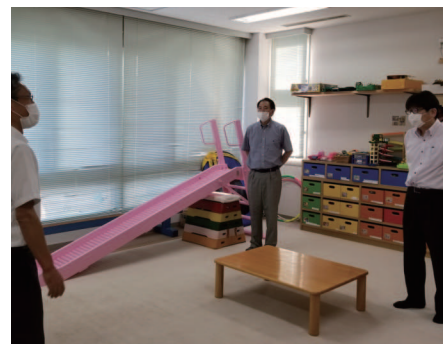
地域児童相談所 連携の必要性と虐待相談について