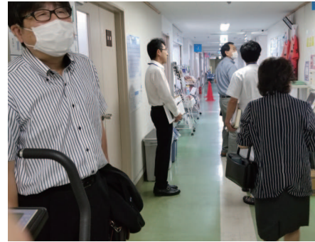
県立柿崎病院 上越地域の病院の連携や役割分担