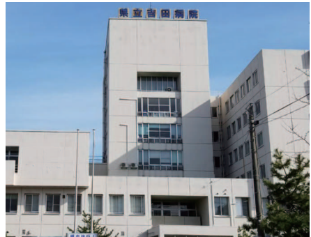
県立吉田病院・看護専門学校 病棟の老朽化・医師の減少が経営に響く