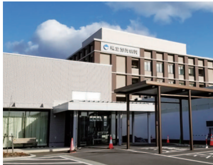
県立加茂病院 県央基幹病院を踏まえ今後の加茂病院の役割は