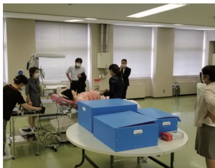
県立看護大学 病院の意識改革が必要