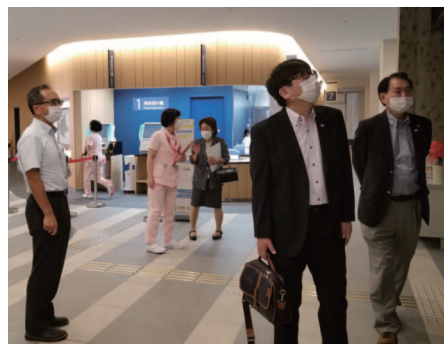
県立中央病院 働き方改革への対応に課題