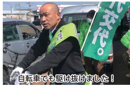
自転車でも駆け抜けました！