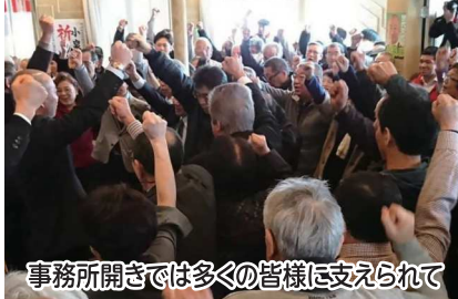
事務所開きでは多くの皆様に支えられて