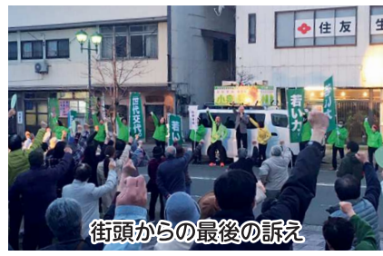
街頭からの最後の訴え